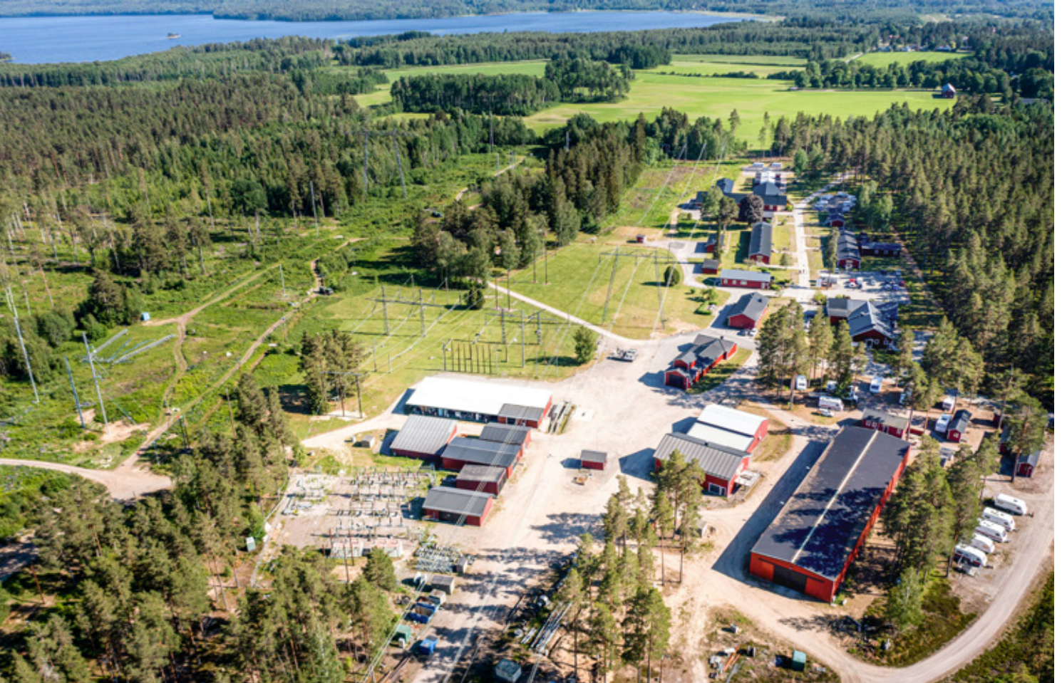
➤ Åsbro kursgård etablerades 1948 – då med fokus på civilpliktsutbildningar.